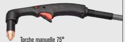
Torche manuelle 75°

(pour plus d'options de torche, consulter www.hypertherm.com )