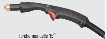
Torche manuelle 15°